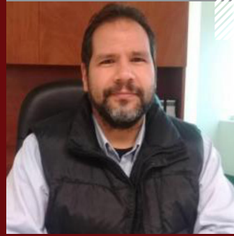
RICARDO SILVA GUERRERO

EX CONSEJERA ELECTORAL DEL CONSEJO GENERAL DEL INE